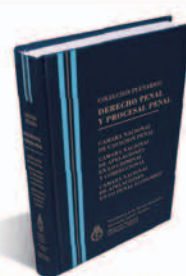
DERECHO PENAL Y PROCESAL PENAL