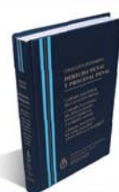
DERECHO PENAL Y PROCESAL PENAL