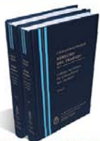
DERECHO DEL TRABAJO