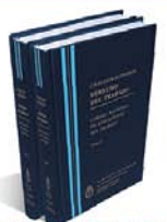
DERECHO DEL TRABAJO